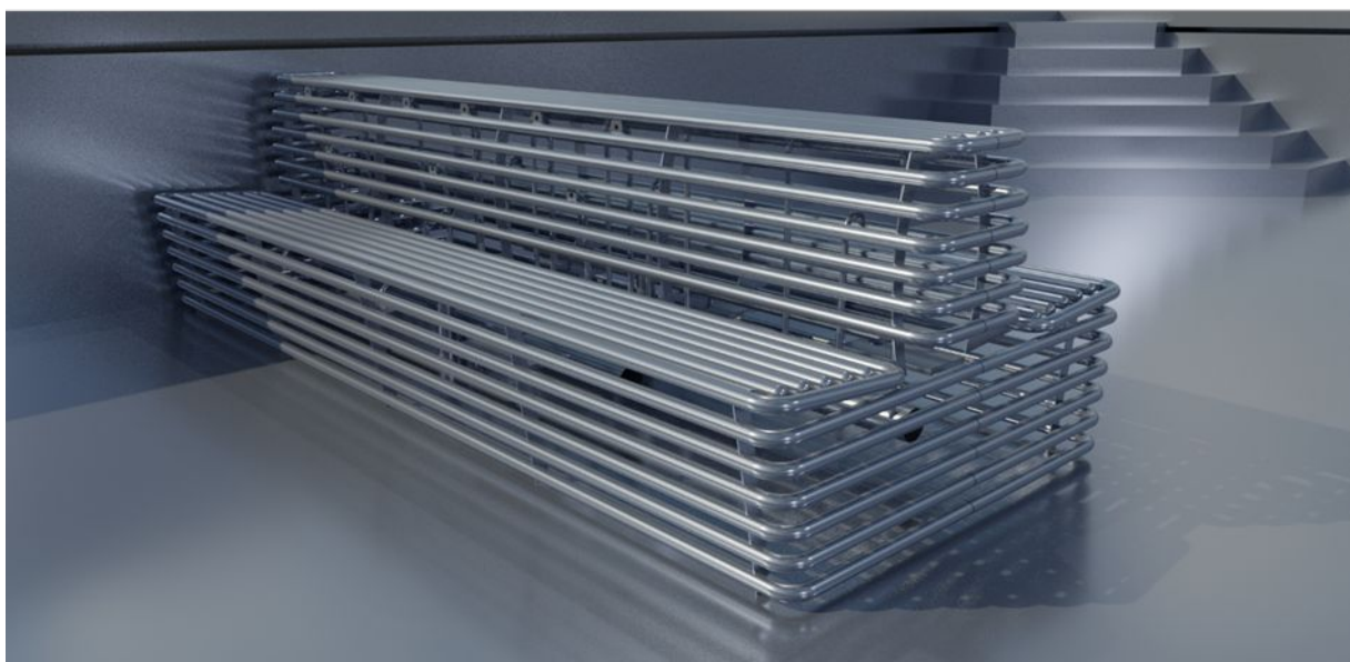
3. ábra: Kettő négy személyes pad egymással háttal

A modulrendszerű megoldás előnye a nagy változatosságon túl a termék családon belüli magas szintű kompatibilitás. Az élmenyemedencékbe több padot kombinálva változatos ülőhelyek készíthetők. Erre lehet jó példa a 3. ábrán látható két darab négyszemélyes pad háttal egymásnak fordításával előálló, összesen 8 személyes megoldás. Hasonlóképpen lehetséges még kifejezetten hosszú, különböző élmenyelemek szerint tagolt padok létrehozása is.