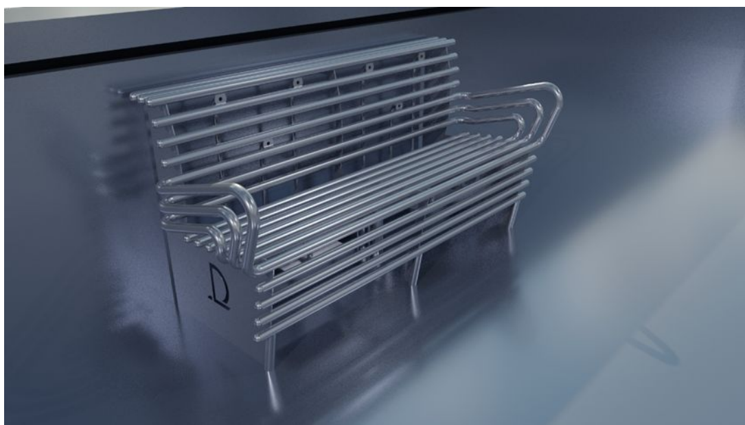
1. ábra: Két személyes pad

A parametrikus tervezés előnyeit kihasználva a megrendelő igényei szerinti pad és élményelem kombináció percek alatt az 1. ábrán látható 3 dimenziós modell formájában állítható elő.